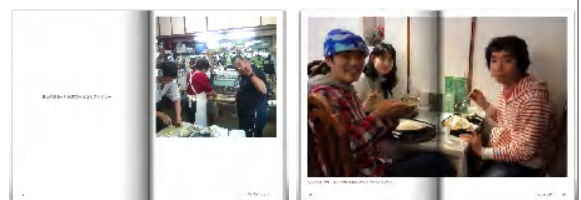
ジャケットタイプ