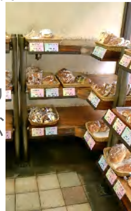
昭和レトロな店内